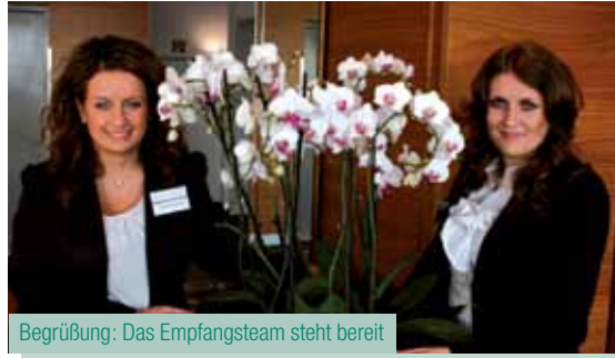
Begrüßung: Das Empfangsteam steht bereit