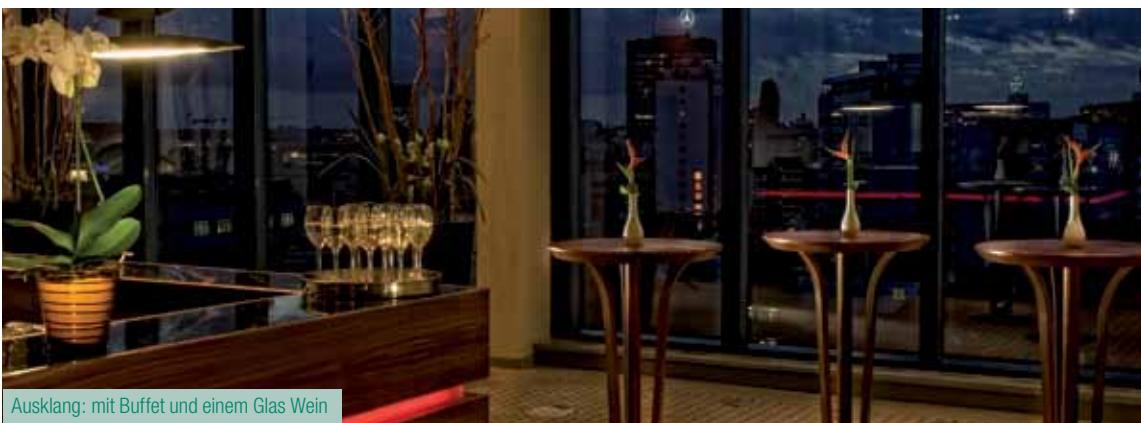
Ausklang: mit Buffet und einem Glas Wein