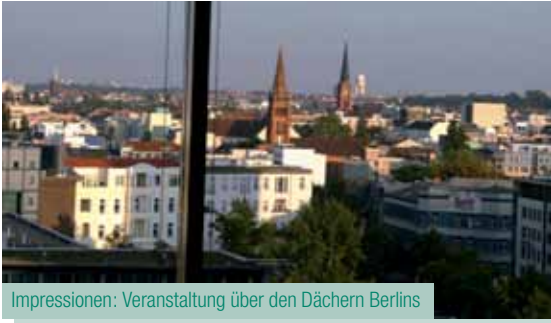
Impressionen: Veranstaltung über den Dächern Berlins