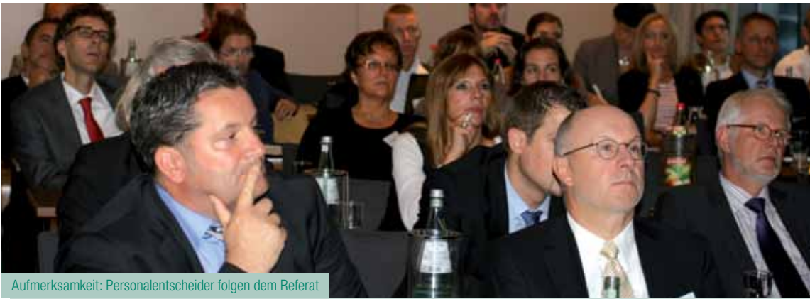
Aufmerksamkeit: Personalentscheider folgen dem Referat