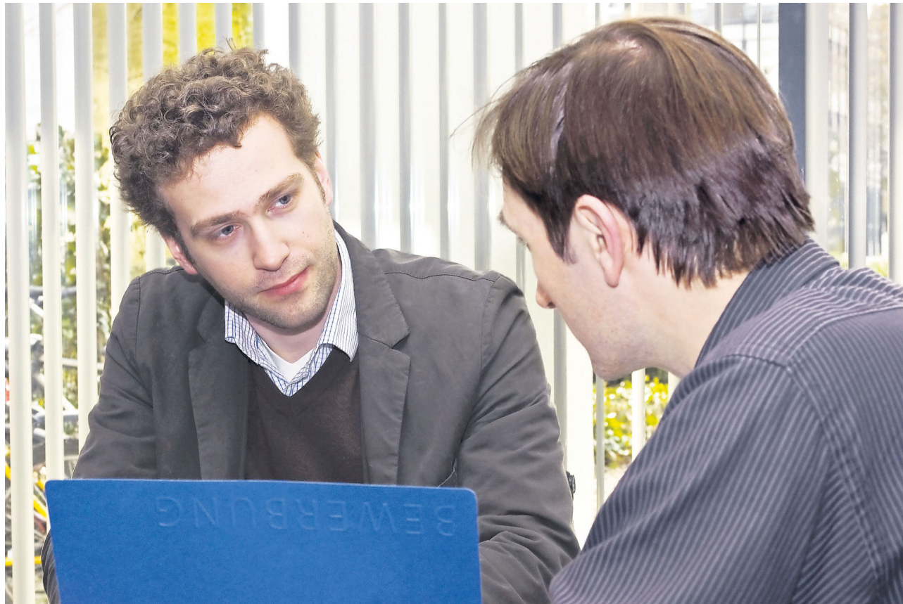
Guter Kontakt. Auf der 5. Berliner Karrierebörse können Bewerber aus dem Bereich der kaufmännischen Berufe in Beratungsgesprächen mit Vermittlern oder Weiterbildungsträgern ihre beruflichen Perspektiven ausloten. Sekretärinnen, Buchhalter, Steuerberater und Finanzexperten werden dringend gesucht.